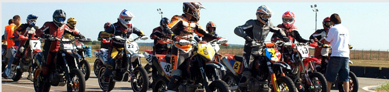
Motocrosul va fi inclus în circuitul turistic al Moreniului