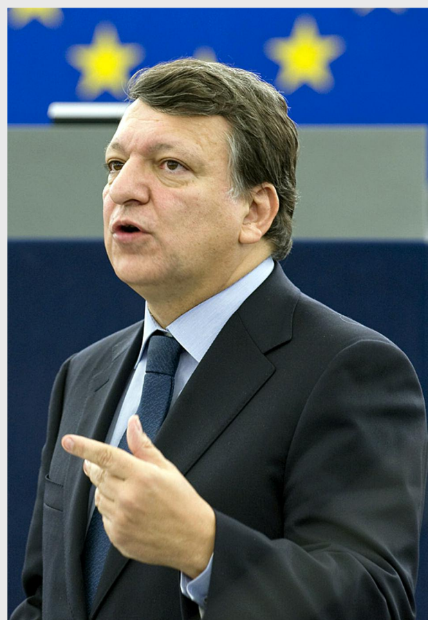
José Manuel Durão Barroso, președintele Comisiei Europene

O proporție de 0,35% din alocarea globală va reveni pentru Asistență Tehnică. Asistența va fi utilizată pentru a sprijini consolidarea instituțională