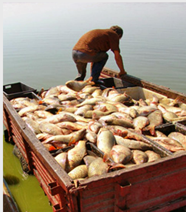
Întreprinzătorii din domeniile acvaculturii și pisciculturii vor putea beneficia de finanțare începând din luna martie