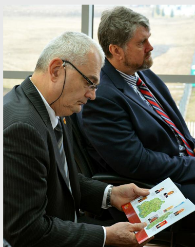
Reprezentanții Casei Româno-Chineze au fost interesați de perspectivele dezvoltării regionale