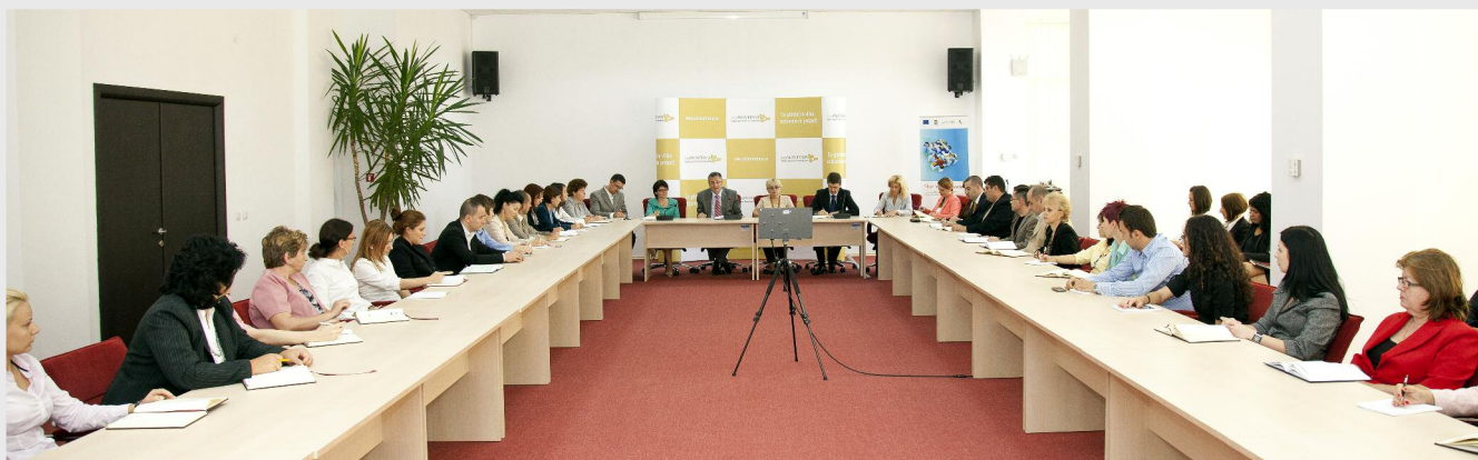
Echipa ADR Sud Muntenia - sala de ședințe, sediul central al Agenției

ligență, de capital uman, să-l folosim în interesul regiunii, reducând migrația lui către București. Sper să găsim soluții, împreună cu cei care au ca principal domeniu de activitate piața muncii, pentru această problemă foarte importantă. Turismul iar este una dintre prioritățile regiunii noastre. Suntem într-o zonă cu un important potențial turistic și sper ca el să devină o latură importantă a economiei din regiunea noastră.