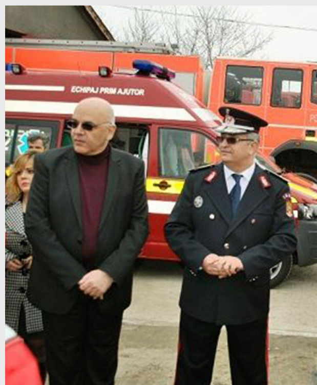
Cele două substații SMURD au fost inaugurate în prezența lui Raed Arafat, secretar de stat în Ministerul Sănătății, și a gen. Ioan Baș, inspectorul general al IGSU

Cele două substații SMURD din Budești și din Chiselet vor avea în dotare câte o autospecială de