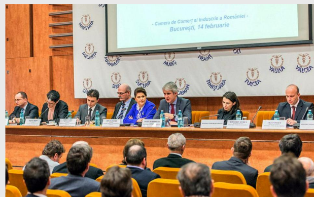
Ministerul Fondurilor Europene a fost reorganizat prin OUG privind completarea și modificarea OUG nr. 96/2012

Prin Hotărârea nr. 43/13.02.2013, privind organizarea și funcționarea Ministerului Fondurilor Eu-