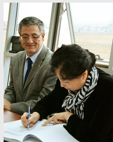
Ambasadorul R.P. Chineze a semnat în cartea de oaspeți a ADR Sud Muntenia